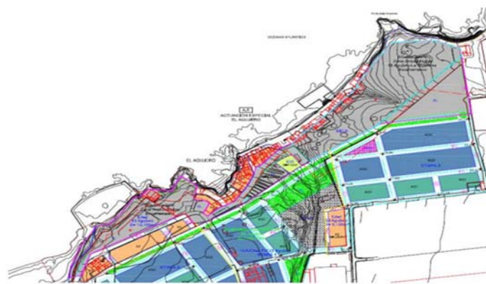
Fig. 1, Fuente: “Documento Ambiental Estratégico de la MM propuesta”.

El sistema General tiene una superficie total de 37.564 m 2 , y su ordenación está remitida a Plan Especial, que hasta la fecha no se ha tramitado. Tal como se aprecia en el siguiente fragmento de plano de la ordenación pormenorizada O.3: